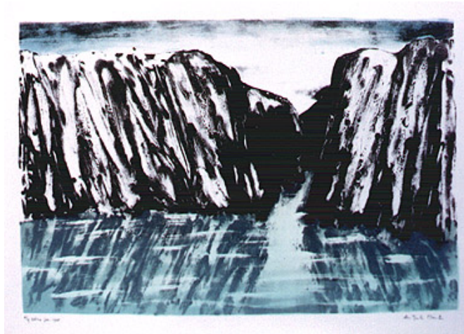
Bergen en riviermonding – lithografie, 50 x 70 cm (ingelijst)

daarmee ging de koop niet door. Jammer voor mij en de man, maar zo werkte dat voor die mensen. Andersom kan gelukkig ook. De een kan iets vinden waarmee hij/zij precies in de roos schiet bij de ander. Zo kwam er eens een vrouw in mijn atelier en ze wist precies welk schilderij ze van mij wilde kopen als cadeau voor haar man. Voor de zekerheid liet ze het eerst aan haar man zien. Hij – de man – was meteen verkocht. En daarmee het schilderij. Wat hierbij meespeelde was dat het schilderij – toeval of niet – iets afbeeldde wat voor hen allebei betekenis had... En uiteraard kun je ook iets aanschaffen terwijl maar één van de twee partners het mooi vindt: agree to disagree!