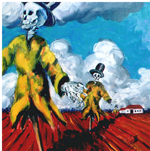
Homeward bound – eitempera en olieverf op paneel, 50 x 50 cm – Collectie Peabody Museum, Boston, USA