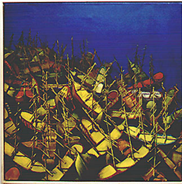
Opstapeling schepen II – olieverf op linnen, 90 x 90 cm (particuliere collectie)

1. Wil je grafiek, of een tekening of een schilderij? Koop dan ook grafiek, of een tekening, of een schilderij, en niet een reproductie ervan. Sta jezelf 'the real thing' toe. Daar word je een stuk gelukkiger van.