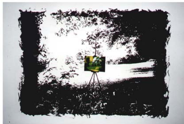
Landschap in landschap – lithografie, 50 x 70 cm (ingelijst)

10. Trek je eigen plan! Als je de beslissing hebt genomen dat je kunst in huis wilt hebben, maak er dan ook inderdaad werk van. Ga gericht op pad. Online, of naar die galerie waar je wel eens langs komt. Doe het! Laat je niet afschrikken omdat je nooit een klant ziet in die galerie. Laat je niet afschrikken omdat je de kunstenaar niet kent. Ga op onderzoek uit en laat je verrassen....!