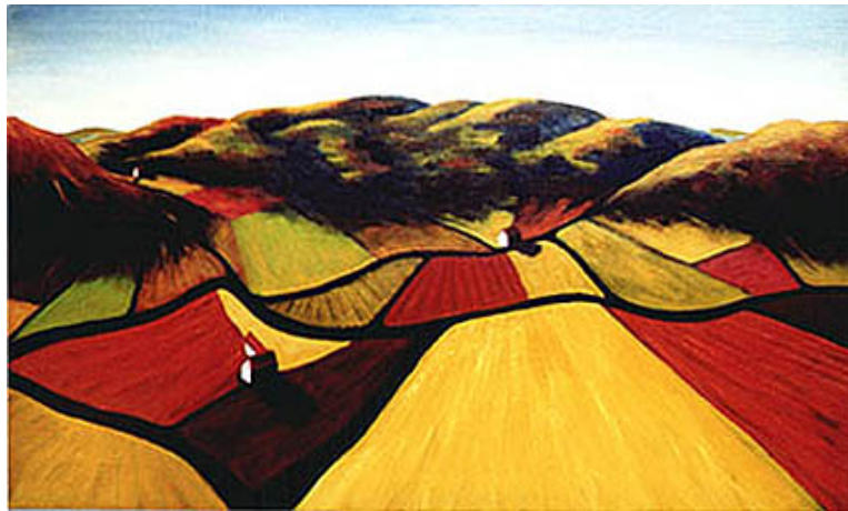
Het eiland Møn IV (Denemarken) – olieverf op linnen, 75 x 125 cm (particuliere collectie)

3. Vraag om achtergrondinformatie. Dit sluit aan op de laatste zin van het vorige punt. Als je een kunstwerk koopt, vraag sowieso naar herkomst, geschiedenis van het werk (als het al wat ouder is), en gegevens over de kunstenaar. Daarmee maak je voor jezelf een zo compleet mogelijk beeld – en verhaal – over het werk dat je wilt kopen.