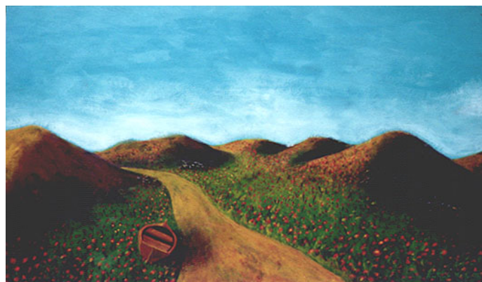
Landschap met sloep, bloemenweide, paadje en heuvels – eitempera op board, 35 x 50 cm (particuliere collectie)

8. Zorg dat je het cadeau krijgt! Ga je binnenkort trouwen of samenwonen, of ben je zoveel jaar samen, of heb je een nieuwe baan, een nieuw huis en komt er een feest? Wijs je vrienden en familie op het kunstwerk dat je graag wilt hebben. Regel wel van tevoren bij de kunstenaar (of galerie) een optie op het gewenste kunstwerk, dat niet een ander het tussendoor koopt en jij met lege handen staat. Als alle feestgangers een duit in het zakje doen, reken maar dat je dan iets moois kunt kopen!