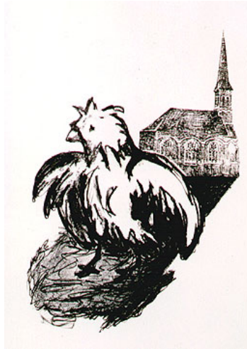
Kip & kerk – lithografie, 70 x 50 cm (ingelijst)

9. Koop van de kunstenaar zelf. Natuurlijk kun je kunst kopen in een galerie, op een kunstbeurs of op een veiling. Ik doe dat wel eens, kunst kopen op een veiling. Dan is het wel eens lastig te achterhalen hoe het precies zit met zo'n werk. En soms kom je er gewoon niet achter.... Het mooiste is wanneer je meteen bij de bron kunt komen: de kunstenaar zelf. Dan weet je zeker dat het werk authentiek is, en je krijgt uit eerste hand het verhaal bij het kunstwerk te horen. En jij kunt daar vervolgens jouw verhaal aan toevoegen. Als je rechtstreeks koopt van de kunstenaar, ben je waarschijnlijk aanzienlijk gunstiger uit, want van de prijs voor een kunstwerk in een galerie, gaat vaak 50% naar de galerie!