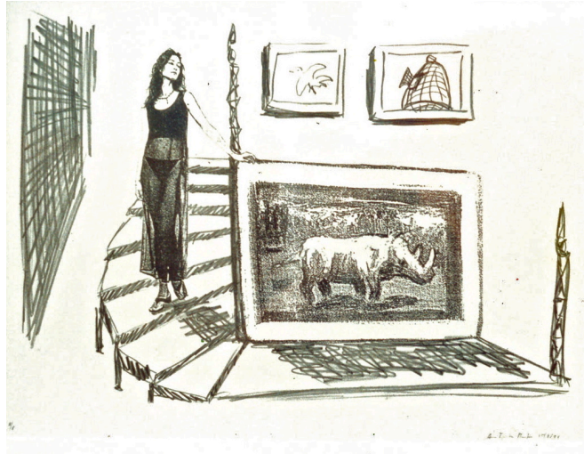
Vrouw met rhinoceros – lithografie, 50 x 70 cm (ingelijst)

3. Vraag om achtergrondinformatie. Dit sluit aan op de laatste zin van het vorige punt. Als je een kunstwerk koopt, vraag sowieso naar herkomst, geschiedenis van het werk (als het al wat ouder is), en gegevens over de kunstenaar. Daarmee maak je voor jezelf een zo compleet mogelijk beeld – en verhaal – over het werk dat je wilt kopen.